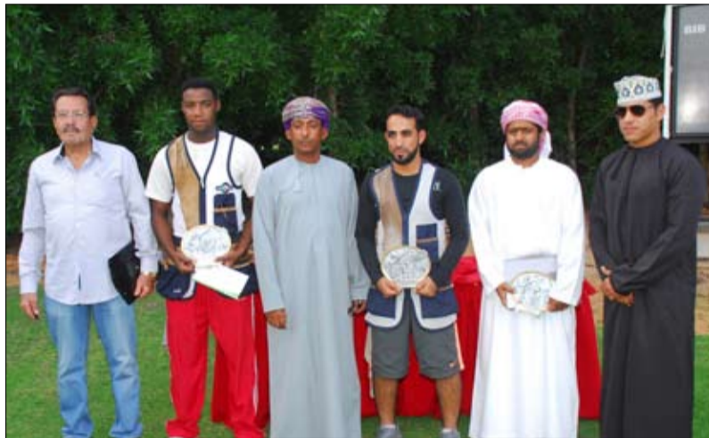
من الرجال والسيدات والناشئين من المواطنين المجال وتشجيعهم على ممارسة هذا النوع من والمقيمين لاكتساب المزيد من الخبرة في هذا الرياضة.