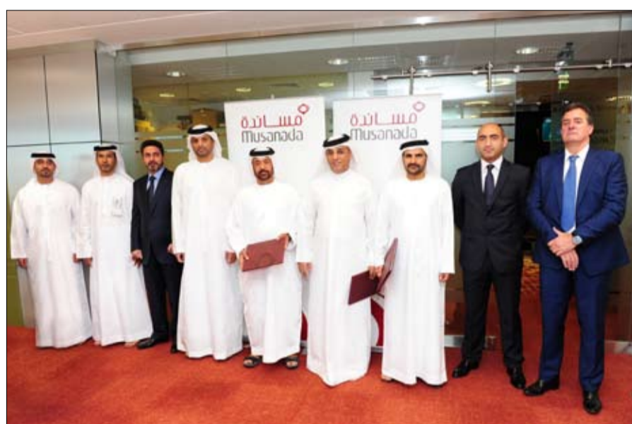
مديرية المرور والدوريات بشرطة أبوظبي، وكذلك جاسكو ودولفين للطاقة. الاتحاد للقطارات، وشركة أبوظبي للنقل والتحكم (ترانسكو) وإدارة هندسة المرور وسلامة الطرق في

سمو الشيخ محمد بن زايد آل نهيان ولي عهد أبوظبي نائب القائد الأعلى للقوات المسلحة رئيس المجلس التنفيذي لإمارة أبوظبي، على التنمية المتوازنة في جميع أنحاء إمارة أبوظبي بالتعاون مع شركاء التنمية التنموية المتطورة التي تشهدها مختلف المدن والمناطق، كما يأتي إطلاق مشروع طريق أبوظبي - دبي بالتزامن مع احتفالات دولة الإمارات باليوم الوطني الثاني والأربعين. وقال سعادته: يعد مشروع طريق أبوظبي - دبي الرئيسي الجديد أحد أكبر وأهم مشاريع الطرق في إمارة أبوظبي، والذي يهدف إلى تطوير البنية التحتية للطرق في أبوظبي 2030 والخطة الشاملة للنقل البري والتي تم تطويرها للارتقاء بالبنية التحتية لشبكة