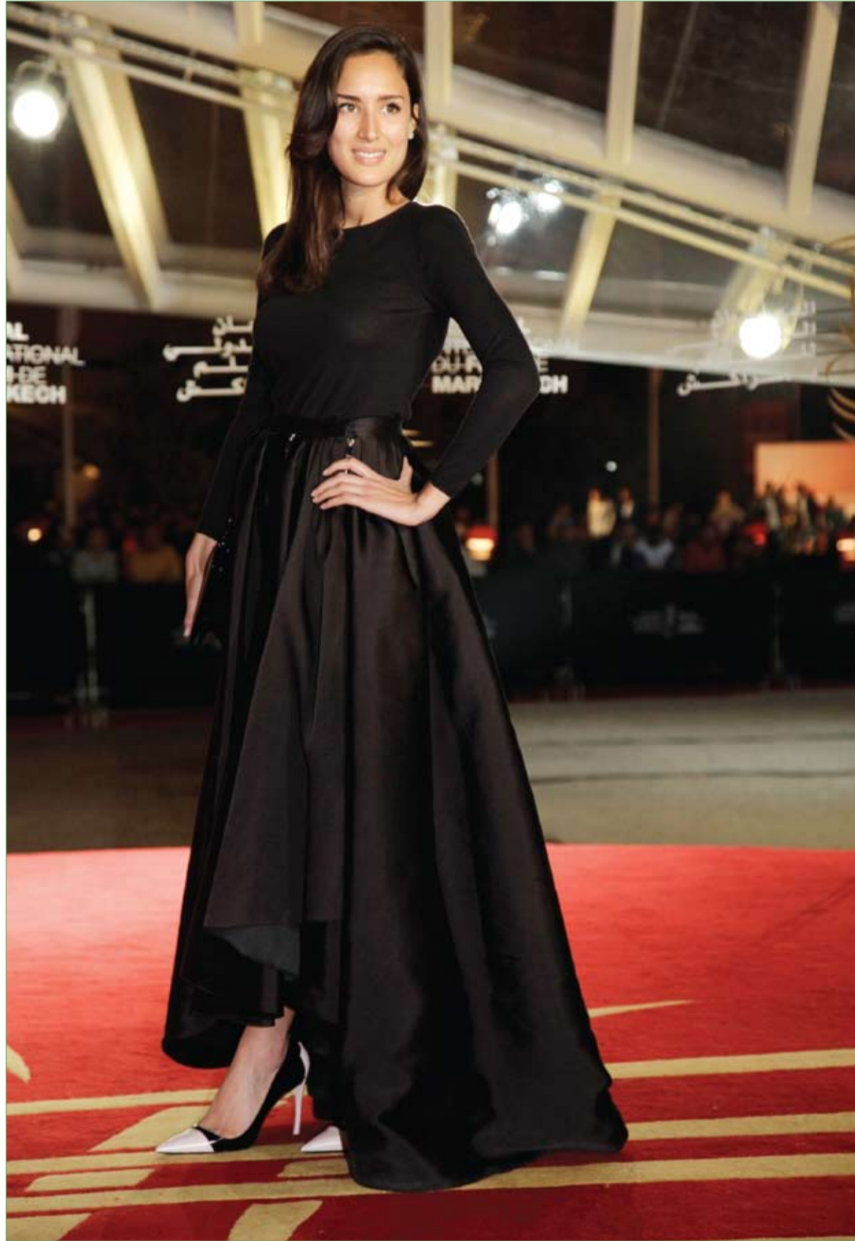
الممثلة الفرنسية سارة كازمي خلال حضورها مهرجان مراكش السينمائي الدولي.

هذا الغطاء متاح حالياً للطلب المسبق عبر الإنترنت، فيما ستوافر بالأسواق بحلول شهر يناير كانون الثاني 2014 بسعر 99 دولاراً أمريكياً.